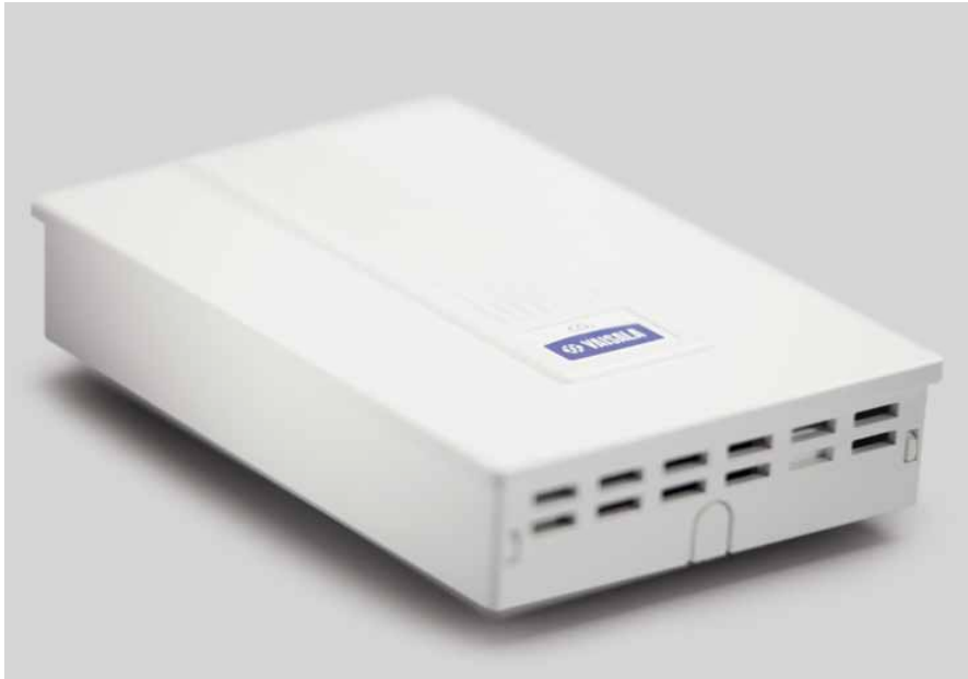
维萨拉CARBOCAP®二氧化碳变送器应用于高标准的暖通空调控制工程