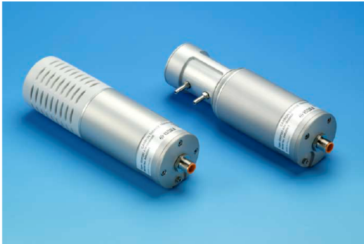
GMP343是现场生态学CO 2 测量的理想设备。