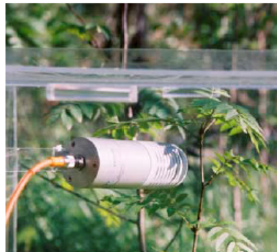
GMP343非常适合于盒式土壤呼吸测量。扩散式探头减小了由于泵吸系统压差造成的测量误差。

GMP343可以使用±0.5%的样气进行校准、线性化。如有必要，用户可以使用更高精度的样气进行多点校准，GMP343可提供10个用户定义的校准点。