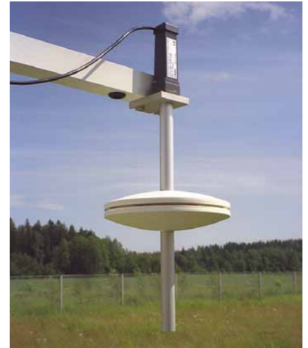
PTB210与SPH10静压头组合使用。

PTB210气压计设计有多个压力量程，有两种基本选型可供选择：串行输出：500 ... 1100hPa和50 ... 1100hPa，模拟输出：500 ... 1100hPa之间不同的量程。